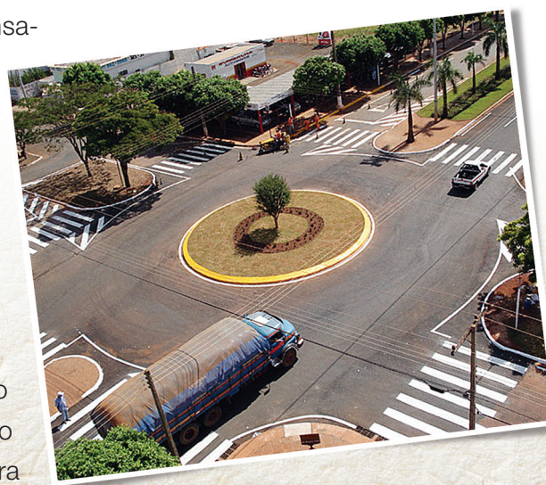
Rotatória, Chapadão do Sul

Assim, os conteúdos partirão do universo cultural dos alunos que, confrontado com o conhecimento formal, promoverá uma nova leitura da realidade, refletindo em mudança de atitude frente ao trânsito.